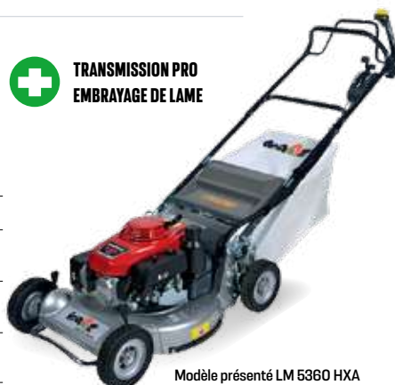
Modèle présenté LM 5360 HXA

Moteur ST 550. 586 cc. Bicylindre. 2 roues motrices. Plateau de coupe 100 cm. Existe en version 4 roues motrices 500WX.