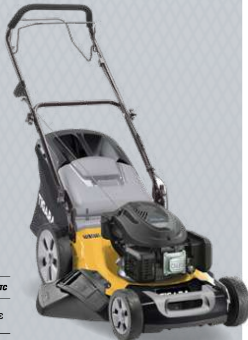
Modèle présenté TG55TS